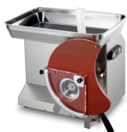
Optional Format M